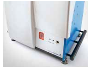
Conception compacte pour paillasse