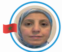
PR SAADI H