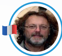
PR AGOSTINI AUBERT